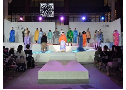
わからんコレクション(11月)