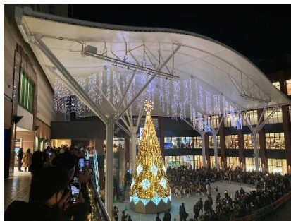
ナガサキ☆テラス(12月)