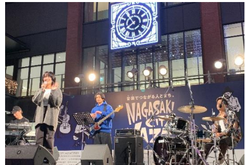
NAGASAKI CITY JAZZ(12月)