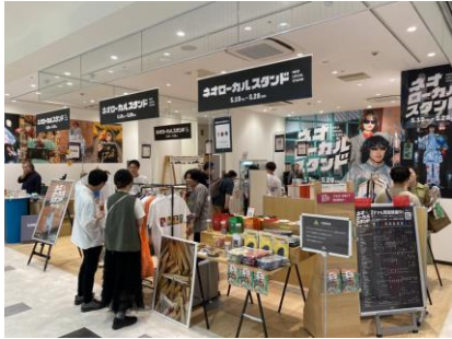
ネオローカルスタンド(5月)