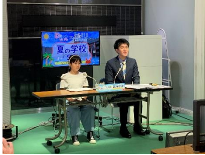
キッズワークショップ(8月)