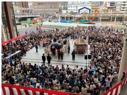
長崎くんち 庭先まわり(10月)