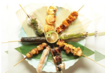
海鮮炙り屋 いびき地 (海鮮炙り焼・魚串)