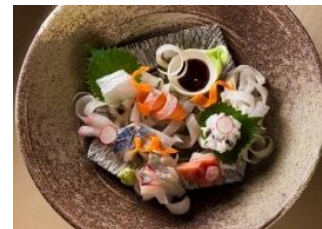
フクブクロ (海鮮居酒屋)