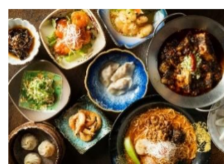
台湾水餃 LAO LEE (台湾バル)