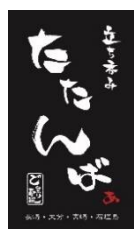
立ち呑み たたんばあ (立ち呑み)