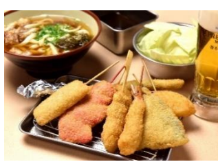
串カツ田中 (串カツ)