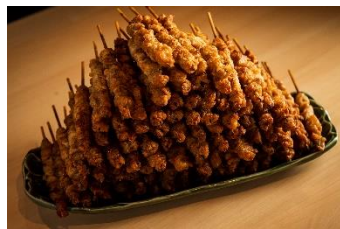
博多ぐるぐるとりかわ竹乃屋 (焼き鳥)